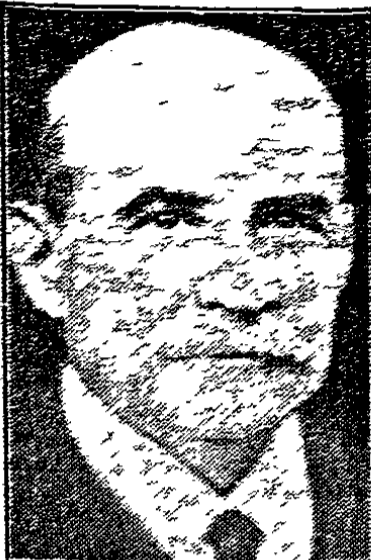
J. P. MORGAN