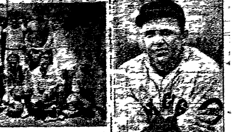
Berleigh Grimes, veterano de los Cardinals, se ve aquí con el nuevo uniforme con que participará este año con los Cubs de Chicago.