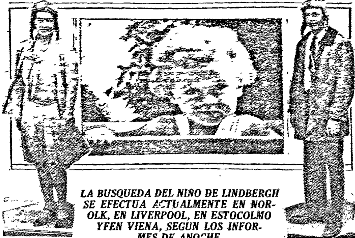
LA BUSQUEDA DEL NIÑO DE LINDBERGH SE EFECTUA ACTUALMENTE EN NOROLK, EN LIVERPOOL, EN ESTOCOLMO YFEN VIENA, SEGUN LOS INFORMES DE ANOCHE

(Servicio de la Associated Press y de la Agencia Havas)