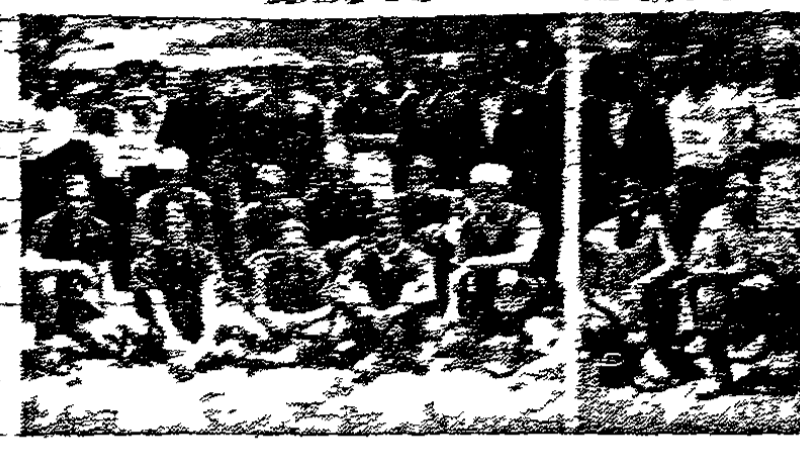
Cumplido el ofrecimiento que la Escuela Deportiva del DIARIO DE COSTA RICA hizo al fútbol. Los jugadores de Alajuela que participaron en un encuentro de fútbol, por motivo de las fiestas cívicas del 11 de abril.

Para mayores informes dirigirse a SCAGLIETTI HERMANOS en San José.