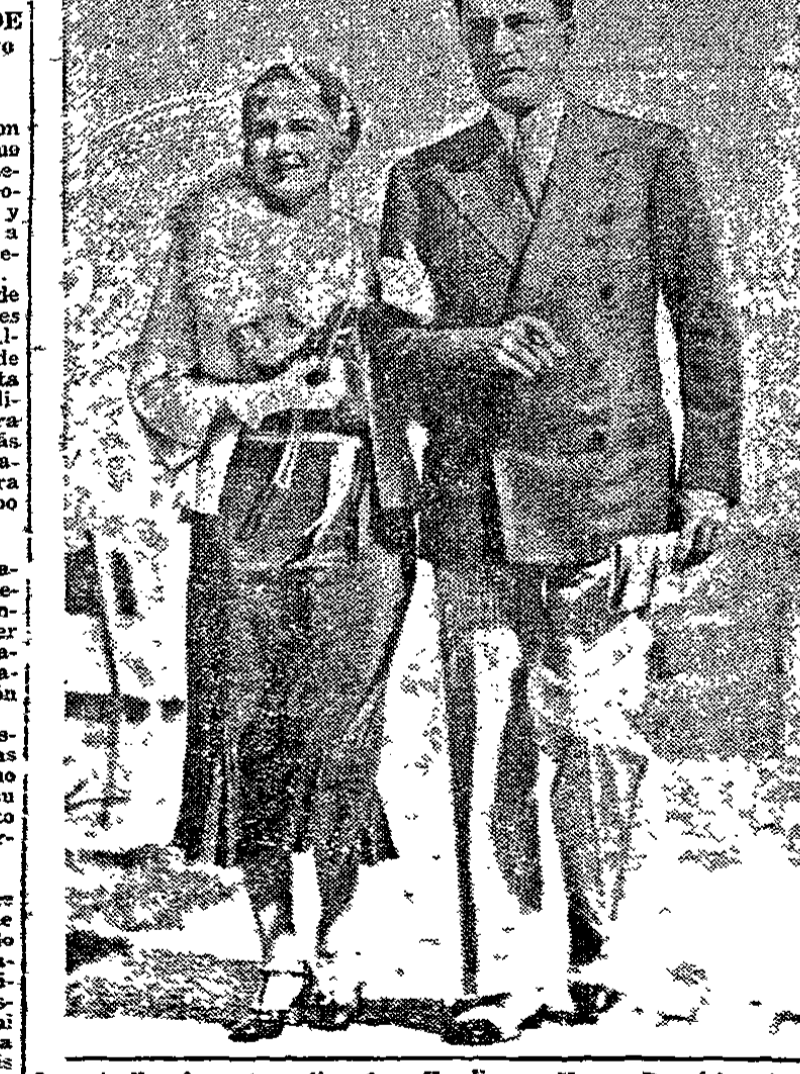
La estrella cinematográfica Ann Harding y Harry Hamister, también actor de la pantalla, anuncian que se divorciarán. El amor se ha desvanecido en esta pareja, pero se preparan para criar sus hijos como el nombre de Hamister, que se conoce como el "marido de Ann Harding".